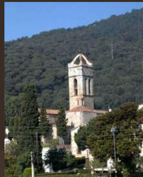
La sagrera medieval i les capelles Premià de Dalt