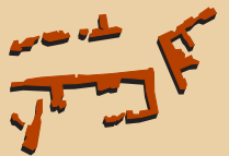
4 Sector de tres cases i un carrer Sector de tres casas y una calle